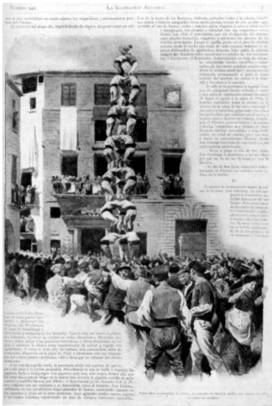
Il·lustració de Josep Lluís Pellicer que reproduceix la caiguda d'un fictici tres de deu, encara que hi manca l'aixecador. En La masia dels amors també es fa referència a una caiguda d'un castell semblant.

Al últim quan ja'ls dos finit havían y quan lo bon pastor lo cel signantne en deya: -Déu es just! Los que tenían mig montat lo castell, bambolejantne un crit donan, s'estrenyen, s'angunian, y á terra cahuen. (...)