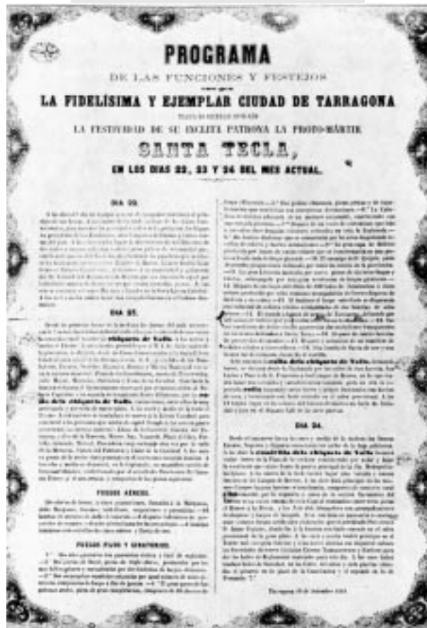
Programa de les festes de Santa Tecla, de Tarragona, de l'any 1864. Francesc-Pelai Briz va publicar la narració La masia dels amors dos anys més tard.

La descripció del ball de diables és interessant especialment en l'aspecte tècnic 4 , mentre que les referències al ball de la Rosaura són de notable rellevància en ser aquest text de Briz el primer literari, cronològicament parlant, que dóna notícia d'aquest ball parlat. En un altre article veu-