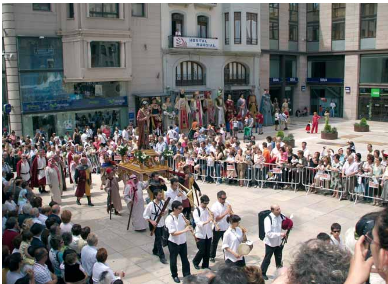
Entrada de Sant Anastasi a la plaça de Sant Joan abans de l'ofrena de flors.

tant reformulació en la denominació, per bé que pot semblar anecdòtica, és molt il·lustrativa d'aquesta indefinició global de què parlàvem, d'entrada no es té gens clar com anomenar allò que se celebra.