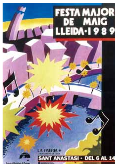
Imatges dels cartells de Festa Major de Lleida dels anys 1979, 1984 i 1989

La llista és llarga, i no s'acaba només amb la cultura popular. I, de fet, la manca de planificació global de la festa provocà que alguns dels elements renovadors introduïts durant els vuitanta i noranta acabessin abandonant el marc de la Festa Major per desenvolupar-se en dates pròximes. Els casos més flagrants són els de l'Aplec del Caragol, que s'independitza completament l'any 1991, i el de la Fira de Titelles, que, per coincidència o no, hi entra precisament el 1991 i se n'escindeix el 1996. La sensació que hom acaba tenint és que si la Festa Major hagués estat ben pensada i reflexionada i no hagués patit aquells mals que citàvem més amunt, aquestes noves expressions renovadores hi haurien pogut tenir un bon encaix dins i servir de plataforma per al necessari relançament. Ara bé, finalment, el que ha passat és que s'han aprofitat del marc de la Festa Major per créixer i expandir-se, per acabar abandonant-la, fet que ha donat lloc a nous esdeveniments festius paral·lels i, alhora, nous guetos socioculturals. I, a més, han trobat la complicitat de les institucions i responsables festius per fer-ho així.