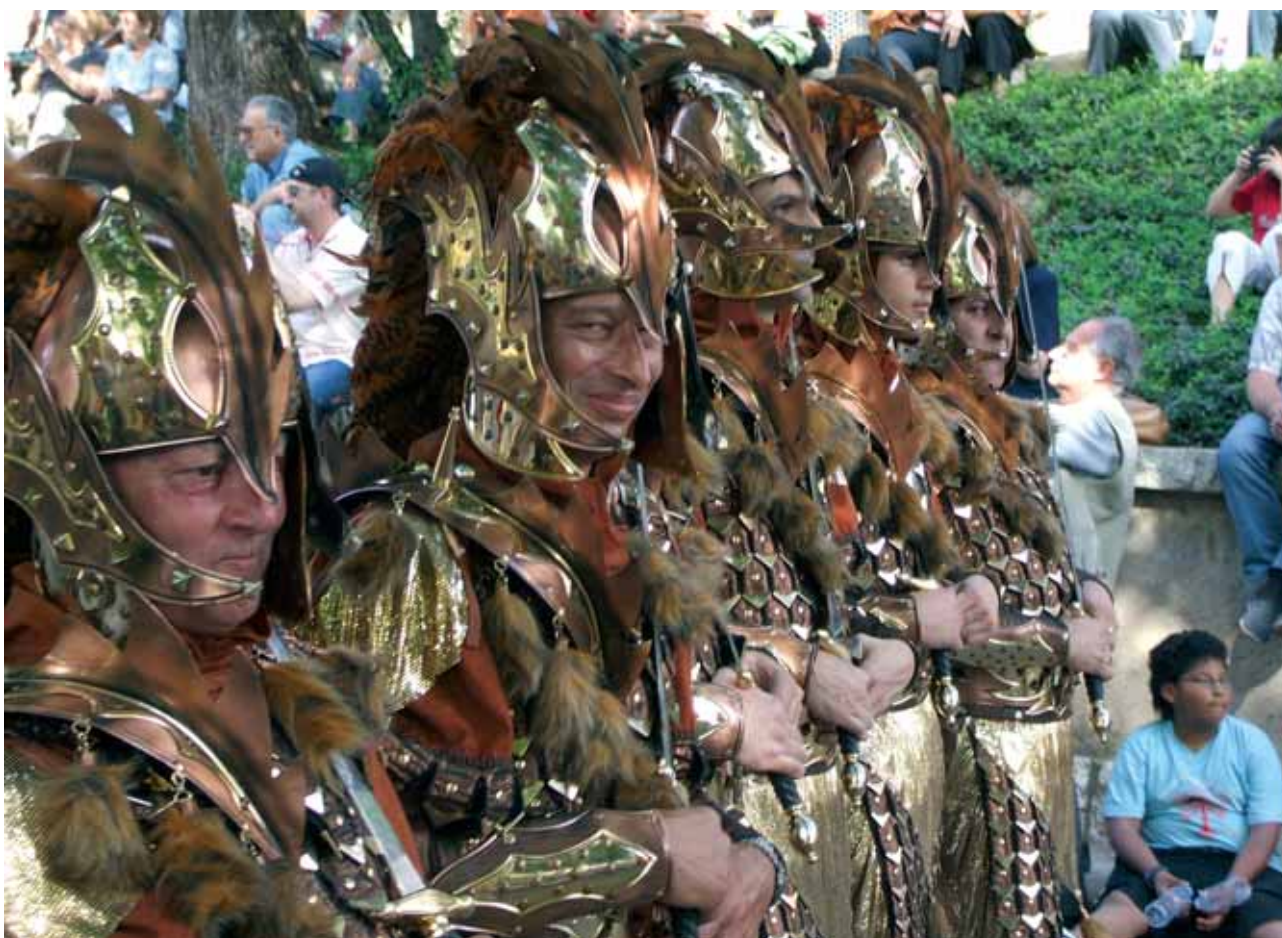
Festa de Moros i Cristians.

da, enmig de la desídia general. Potser hauria calgut plan-tejar-se quin sentit té celebrar la Festa Major l'onze de maig, si de Sant Anastasi —que és a llaor de qui s'instaurà la festa en el passat—, tothom n'acaba passant olímpicament?