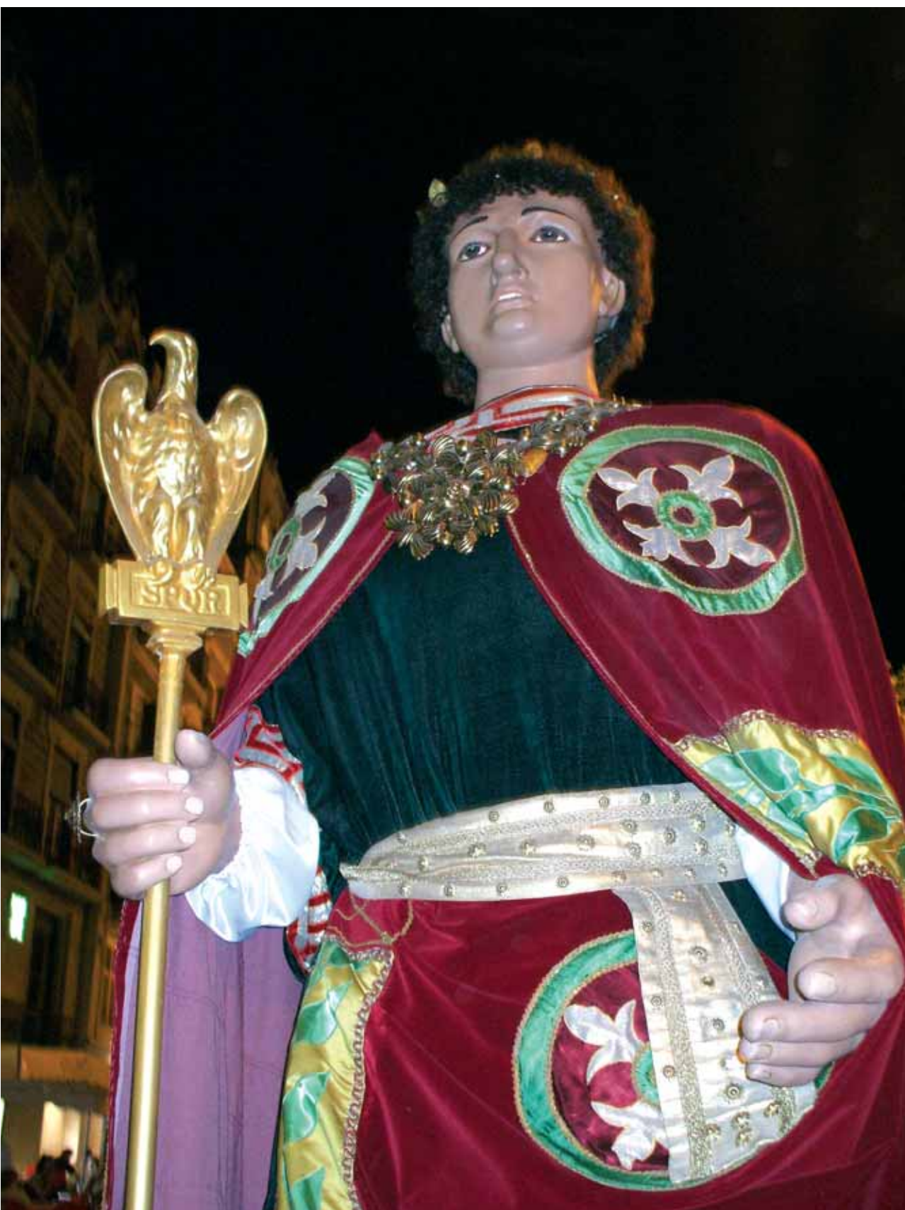
El gegant Romà.